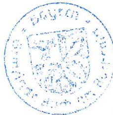
Geisberger Erster Bürgermeister